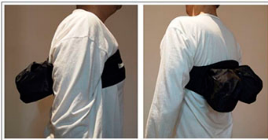
Figura 2 | Cintas torácicas utilizadas para terapia posicional.

Os pacientes elegíveis para a terapia posicional devem ser acompanhados tão criteriosamente quanto àqueles que fazem uso da PAP, uma vez que a adaptação à restrição, em posição supina durante o sono, não é tão simples como aparenta ser e, em alguns casos, pode se tornar impraticável. Assim, devem ser igualmente alertados sobre as limitações do método e esclarecidos sobre outras possibilidades terapêuticas, como o uso da terapia com PAP. Além disso, idealmente, o paciente deve repetir a polissonografia com o acessório para restrição da posição, no esforço de que a eficácia da terapia posicional seja confirmada.